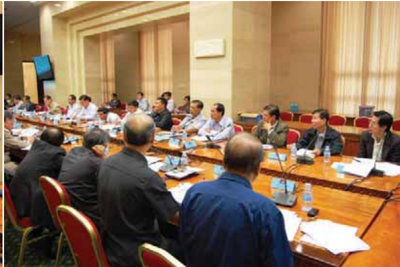
រូបភាពក្នុងកិច្ចប្រជុំ ដើម្បីវិភាគស្ថានភាពសេដ្ឋកិច្ច សង្គមកិច្ច និងវប្បធម៌ ប្រចាំឆ្នាំ២០១០