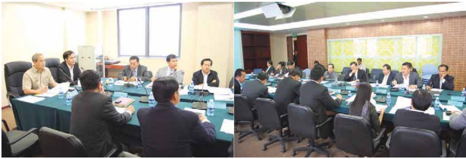
អង្គប្រជុំជំនាញបច្ចេកទេស បានផ្អាកការពិភាក្សាលើសេចក្តីព្រាងឯកសារនេះនៅមាត្រា៥១ ។

អង្គប្រជុំជំនាញបច្ចេកទេស បានបន្តពិនិត្យពិភាក្សាលើសេចក្តីព្រាងនេះយ៉ាងប្រុងប្រយ័ត្ន ហើយបានសម្រេចកែសម្រួលខ្លឹមសារ ទម្រង់ ពាក្យពេចន៍ និងឃ្លាប្រយោគ រហូតដល់មាត្រា៥១។ អង្គប្រជុំបានសម្រេចបង្កើតក្រុមការងារដែលមានសមាសភាព ECOSOCC ក្រុមប្រឹក្សាអ្នកច្បាប់ និងតំណាងក្រសួងសាមី ដើម្បីជួយពិនិត្យ និងកែសម្រួលខ្លឹមសារបន្តនៃសេចក្តីព្រាងនេះ រួចយកដាក់ប្រជុំជំនាញបច្ចេកទេសនៅពេលក្រោយទៀត ។